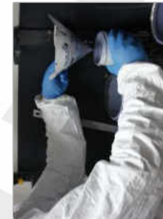
Rapport mélange respecté à l'aide de gabarets doseurs gradués