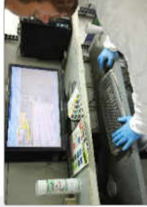
Laboration des RA - à partir d'un logiciel dédié