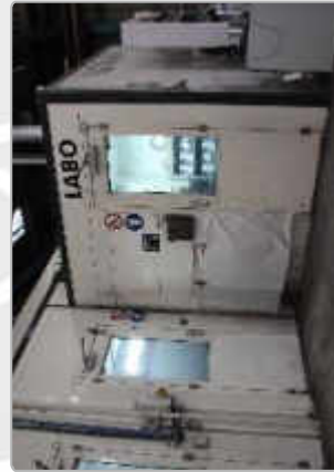
Laboratoire de peinture certifié Diamant

Le service laqueage SDA a été certifié niveau Diamant à la suite d'un audit qui a été effectué de manière indépendante. Cette certification, renouvelée chaque année, est un gage de la qualité et du professionnalisme du service de laqueage SDA. L'audit a été porté sur une série de points de contrôle, que la société SDA a dûment rassemblés :