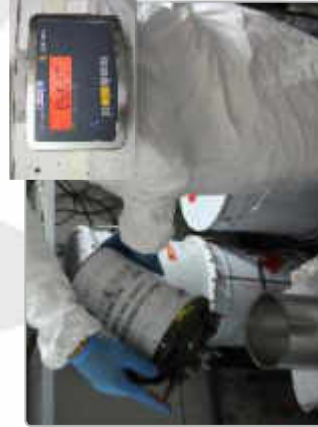
Fabrication de la peinture au diluante de granulométrie