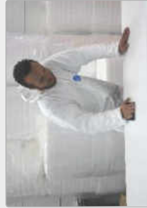
Préparation du support à peindre