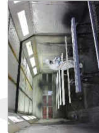
Application de la finition polyuréthane en cabine propre et ventilée